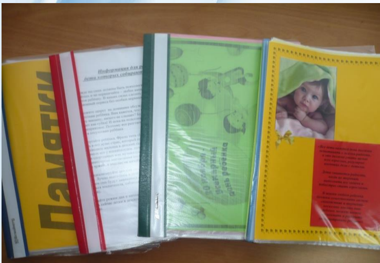
Материалы для консультации